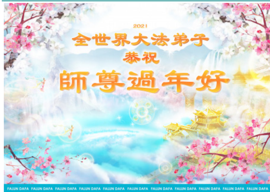
全世界大法弟子恭祝师尊过年好